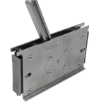
Sabitleyici Montaj araçları